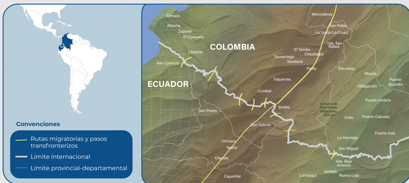
Mapa 01. Zona transfronteriza colombo-ecuatoriana y rutas migratorias. Elaboración propia.