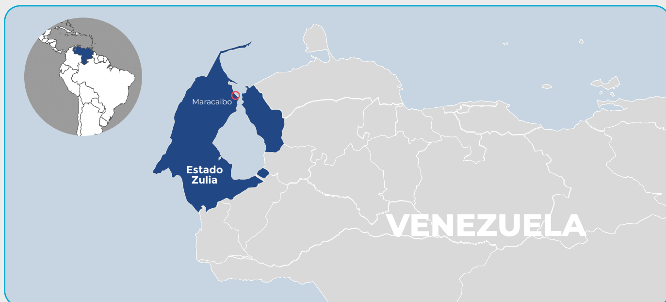
Mapa 01. Ubicación de Maracaibo en el Estado Zulia, Venezuela. Elaboración propia.

Este periodo en esta comunidad se caracteriza por la interacción de amenazas persistentes, altos niveles de vulnerabilidad y capacidades comunitarias insuficientes para responder a las múltiples expresiones de violencia. La normalización de la violencia en los ámbitos familiar y comunitario ha consolidado un ciclo de miedo, impunidad y desconfianza hacia las autoridades, dificultando la denuncia y la búsqueda de apoyo formal.